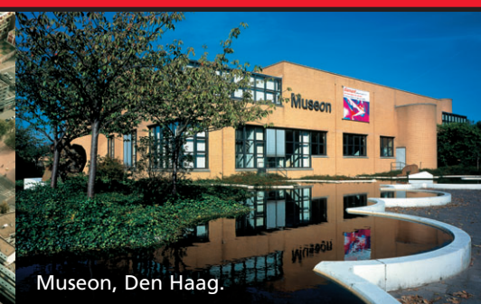
Museon, Den Haag.